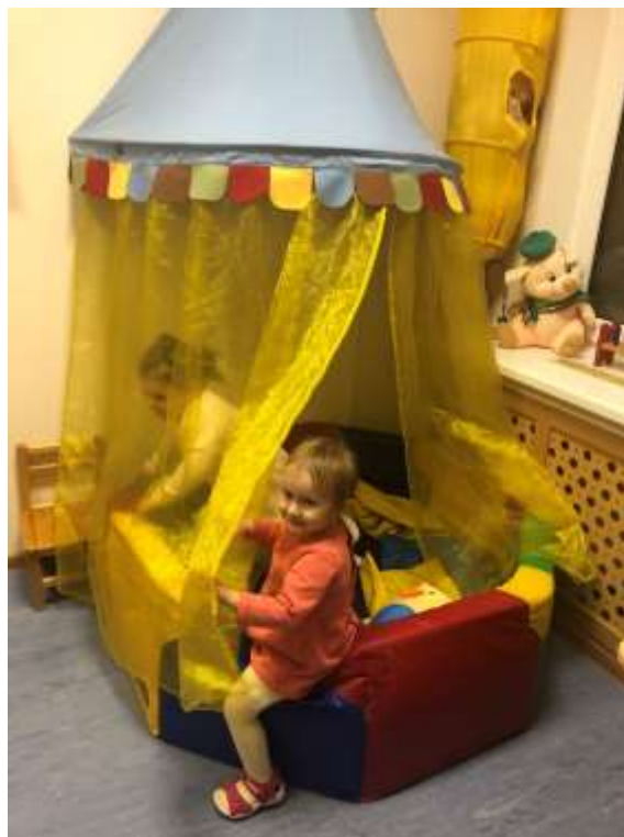
Рис. 9. Зона релаксации (уголок уединения и снятия эмоционального напряжения)