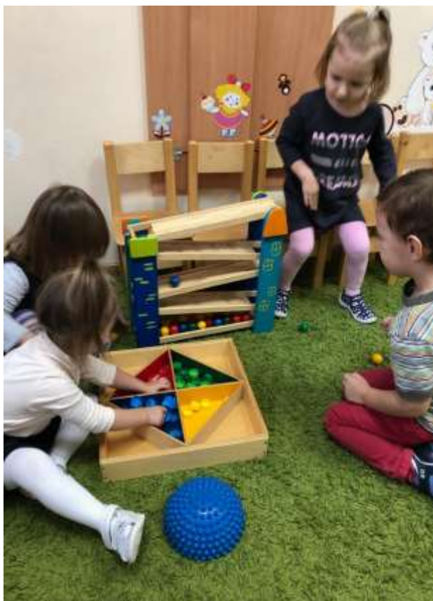
Рис. 3. Стульчики по росту, ковер для игр на полу, игры по системе М. Монтессори