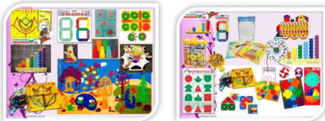
Рис. 4 Развивающие игры Воскобовича

Многие игры сопровождаются сказочным сюжетом, в который органично вплетены логические задания на сравнение, анализ, классификацию, обобщение, понимание математического содержания. Использование сказки немаловажно и для нравственного воспитания дошкольника, формирования у него волевых усилий, эмпатии. Ребенок становится действующим лицом событий, «проживает» сложные, таинственные и веселые сказочные приключения, преодолевает вместе с главным героем препятствия и приводит его к успеху. Все сказки имеют единое сказочное пространство (Фиолетовый Лес) и сквозных героев (Ворон Метр, Малыш Гео и другие).