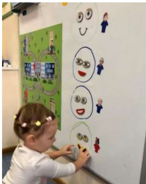
Рис. 1. Магнитно-маркерная доска и магнитное панно «Я дома – я в саду»