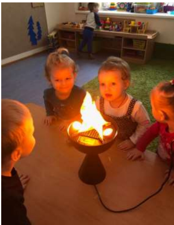
Рис. 6. Трансформируемые столы, электронный прибор сенсорной стимуляции