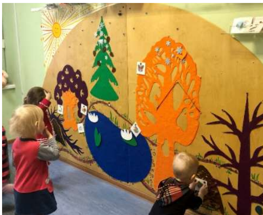
Рис. 11. Адаптированное настенное панно «Фиолетовый лес» В.В. Воскобовича