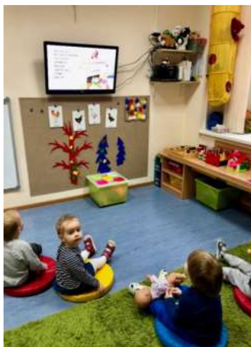
Рис. 2. Ворсовое настенное панно и оборудование для просмотра CD, DVD дисков