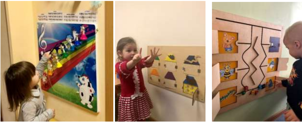
Рис. 12. Развивающие настенные панно по мотивам пособий и героев В.В. Воскобовича