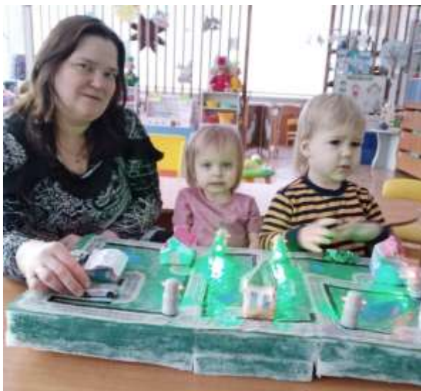
Рис. 1 Игра «Поедем по городу»

которые переключаются на красный и зеленый цвета, есть положение мигающего желтого. Дополнительно подготовлены дорожные знаки. Знаки можно располагать по желанию/необходимости по разному. При ее использовании ребята изучают правила дорожного движения.