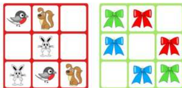
Рис. 2 Судоку для дошкольника

Судоку – это головоломка. Цель головоломки – необходимо заполнить свободные ячейки недостающими фигурами так, чтобы в каждой строке и в каждом столбце каждая фигура встречалась только один раз.