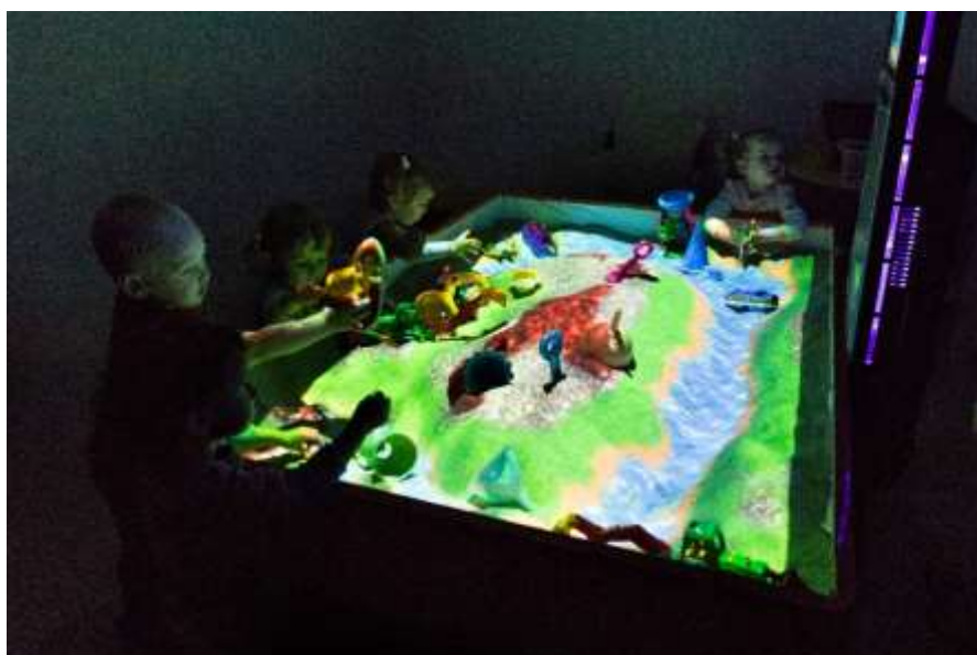
Рис. 10. Интерактивная песочница (сенсорное развитие, развитие мелкой моторики)