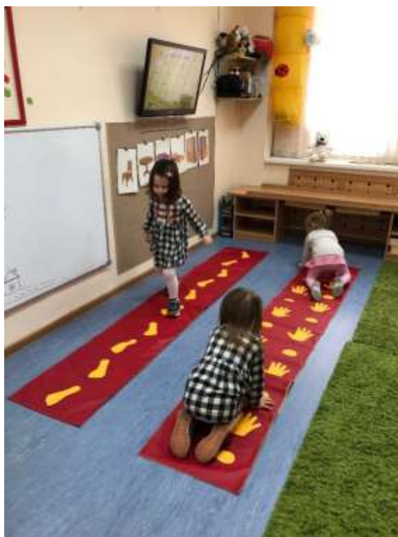
Рис. 7. Тактильные дорожки, игры на развитие крупной моторики