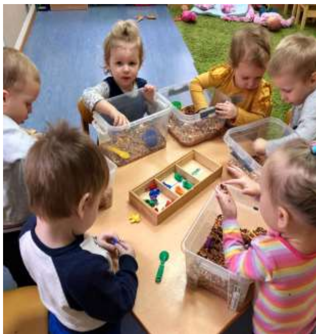
Рис. 5 Столы по росту, сенсорные коробки, игры на развитие мелкой моторики