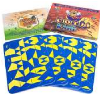
Рис. 1 Набор «Соты Кайе»

Набор "Соты Кайе" состоит из 84 объемных элементов. Элемент имеет форму шестигранника. На лицевой стороне - мозаичный рисунок, обратная сторона однотонная. Рисунков 21 вариант, по 4 штуки каждого.