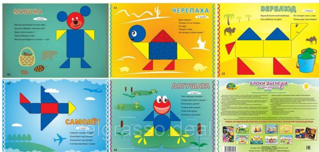
Рис. 3 Варианты логических блоков Дьенеша.