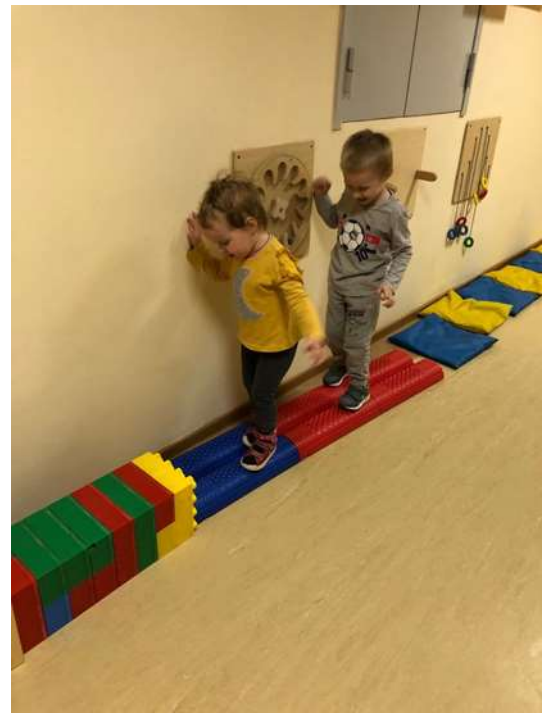
Рис. 8. Зона двигательной рекреации, развитие крупной моторики